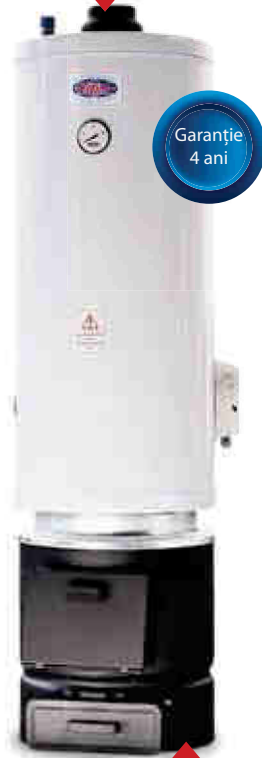
Cazan 2 surse 2 circuite 90l