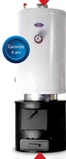
Cazan 6 țevi 90l