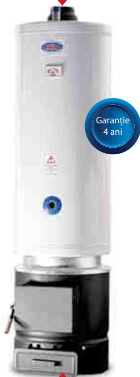
Cazan izolat 90l