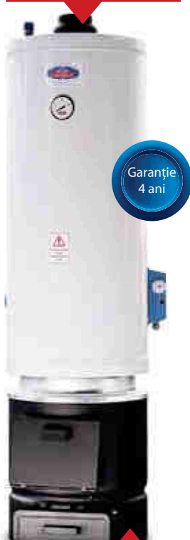
Cazan 2 surse 90l