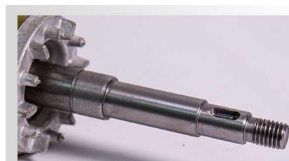
Ax pompa din inox