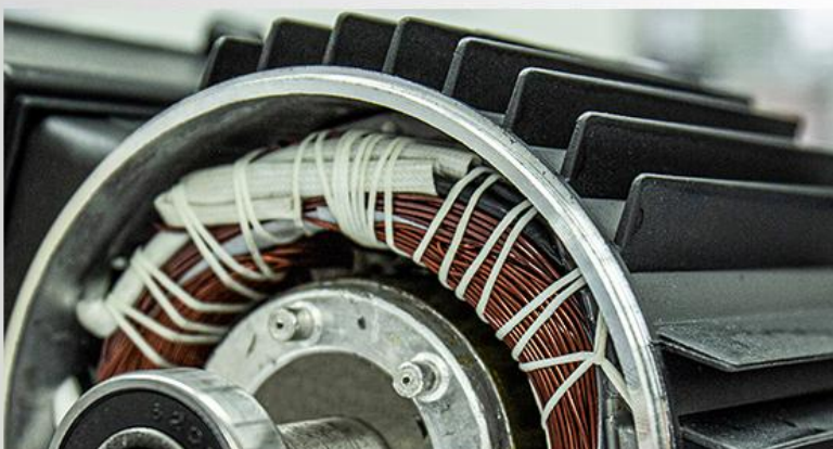
Carcasa motorului din aliaj de aluminiu