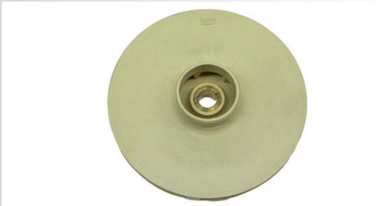
Turbina din PPO(techno-polymer)