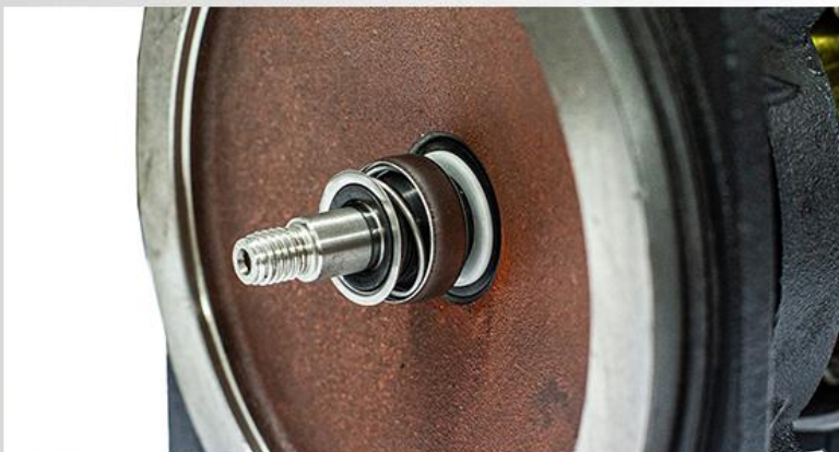
Garnitura mecanică: ceramică/grafit/NBR